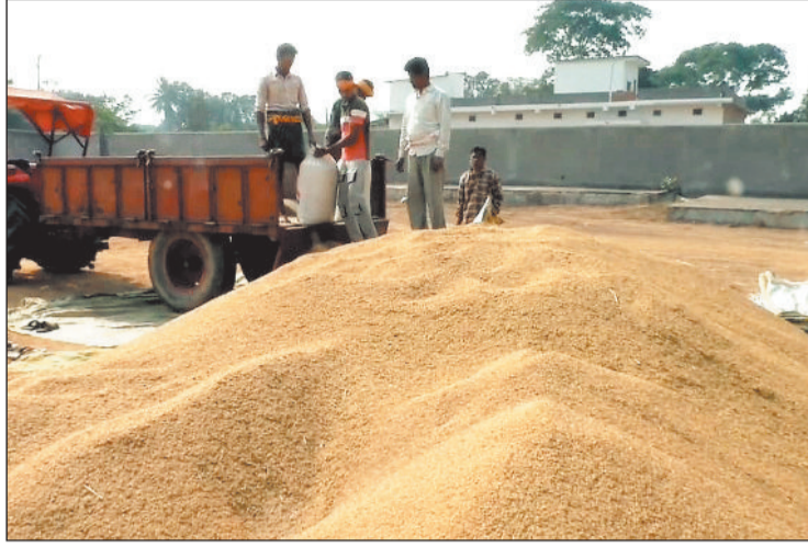
खरीदी केन्द्र में डंप किसानों का धान।

धान बेचने की प्रक्रिया को सहज बनाने के लिए किसानों को टोकन जारी किए जा रहे हैं, वहीं राज्य शासन द्वारा उपलब्ध टोकन तूहर द्वार ऐप ने किसानों को घर बैठे ही आसानी से टोकन प्राप्त करने की सुविधा प्रदान की है। उपार्जन केंद्रों में बारदाना भी पर्याप्त मात्रा में उपलब्ध कराया जा रहा है, जिससे किसानों को किसी भी प्रकार की परेशानी का सामना नहीं करना पड़ रहा।