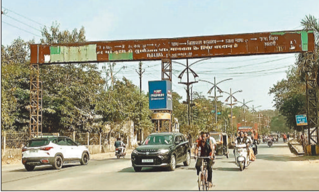
आयुर्वेद अस्पताल के पास जंग लगी स्वागत द्वार।

कोर्ट, कलेक्टोरेट, शासकीय विभागों, कॉलेज, स्कूल जाने वाले इस प्रमुख मार्ग के प्रवेश द्वार में दिशा सूचक ही गायब हैं, सिर्फ जंग लगा बोर्ड ही नजर आ रहा है। इस मार्ग में रोजाना प्रशासनिक, निगम के अधिकारियों, नेताओं व जनप्रतिनिधियों का आना-जाना लगा रहता है, इसके बाद भी वो शहर की शोभा बिगाड़ रहे इस बोर्ड को देख कर अपनी आंखें बंद कर लेते हैं। कुछ माह पूर्व ही शहर सरकार द्वारा शहर के सौंदर्यीकरण के लिए बजट में 1 करोड़ 10 लाख का प्रावधान रखा गया है, लेकिन अब तक इस दिशा में कोई पहल नहीं की गई। विपक्ष भी शहर की सुंदरता पर लगे ग्रहण को नजरअंदाज कर शांत बैठे हुए हैं।